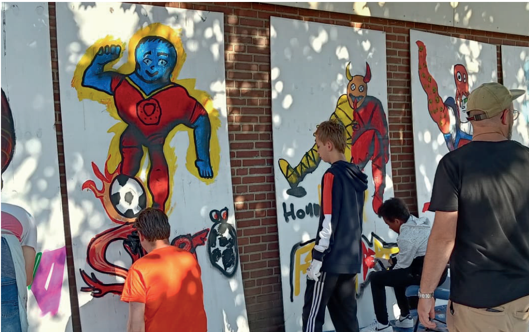
Graffiti project VSO de Linde juli 2022, Deventer

Door corona moest het gebouw begin januari enkele weken sluiten vanwege de gedeeltelijke of volledige lockdowns. In de eerste helft van 2022 mochten 1-op-1 lessen vaak wel, maar groepslessen vonden minder plaats.