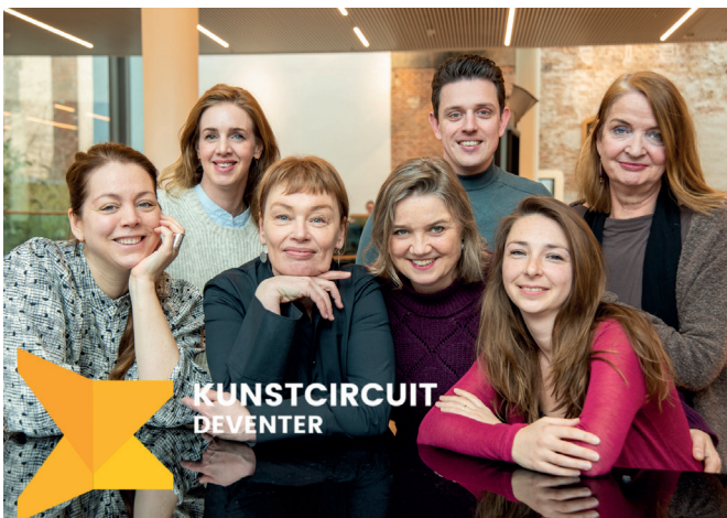
Deventer, Mei 2023 www.kunstcircuit.nl